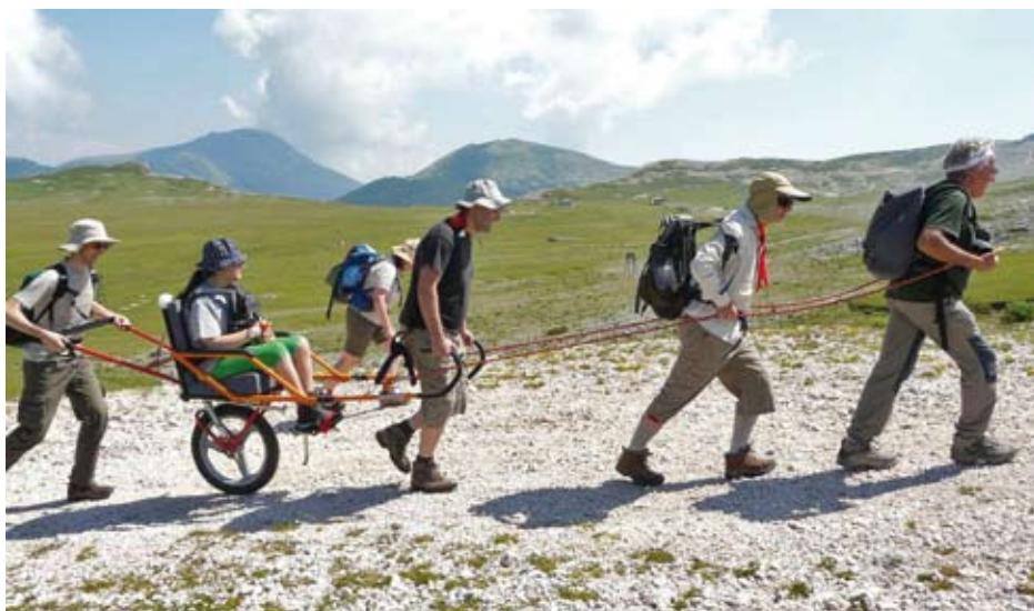
Il gruppo dell'associazione Cammino possibile in escursione sui Monti Ernici (Lazio), insieme a un amico sulla joelette.

Dall'allenamento psicofisico allo studio cartografico del percorso, dal calcolo dei tempi di percorrenza alla scelta dell'abbigliamento e dell'equipaggiamento tecnico. Sono alcuni dei temi affrontati da Giancarlo Cotta Ramusino in “Camminatori. Guida pratica per esploratori, giramondo, viaggiatori, pellegrini, turisti, avventurieri”, in uscita a marzo per Terre di mezzo editore (200 pagine, 14 euro). Un libro che tutti gli zaini dovrebbero avere.